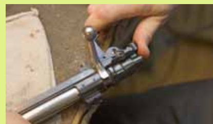
Vissa studsarsäkringar kan drabbas av funktionsfel på grund av kraftig nedsmutsning eller av slitage.