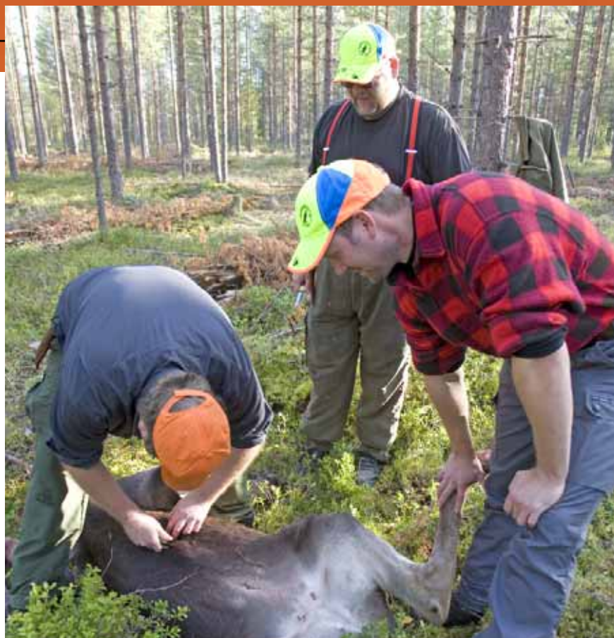
Signalgult är en effektiv säkerhetsfärg. Säkerhetskläder som västar och kepsar, liksom hattband, gör inte bara att jägaren syns bra, de bryter också de mekanismer som leder till att synintryck tolkas på felaktigt sätt i hjärnan.

Men det är lika viktigt med signalfärger första älgjaktssdagen som när haren ska uppvakts i februari! Målfixeringen tar inte semester. □