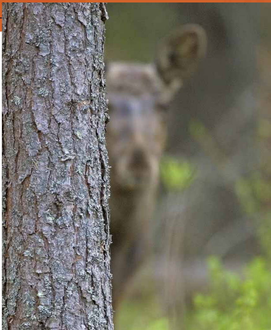
Är du säker på vad du tror ser är vad du verkligen ser? Trötthet och stress kan ibland spela oss ett spratt.

Vare sig man ska bli stridsflygare eller jobba som pilot på ett flygbolag får flygeleven genomgå ett DMT-test.