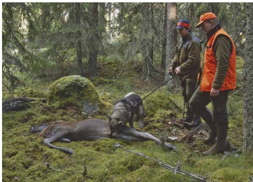
Hundförare är som regel säkerhetsmedvetna och när passkyttarna stannar på sina pass är riskerna vid älgjakt mycket små.

De som blir skjutna är passkyttar. Men inte vilka passkyttar som helst, utan specifikt de som lämnar sina pass på eget initiativ och utan att meddela jaktledaren.