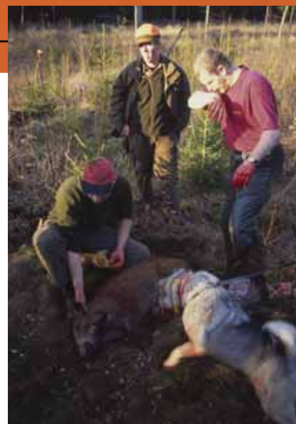
Jaktledarens roll är särskilt reglerad vid jakt på älg och kronvilt, men jaktledaren är lika viktig vid all gemensamhetsjakt.

Men om jaktledaren verkligen vill göra ett bra jobb med säkerheten så