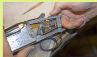
Hagelvapnets säkring ska vara lätt att manövrera med distinkta lägen.