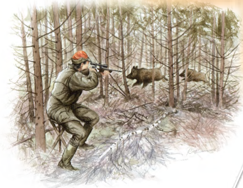
8. Viltväxel mellan två tätningar