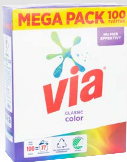
Via Classic Color