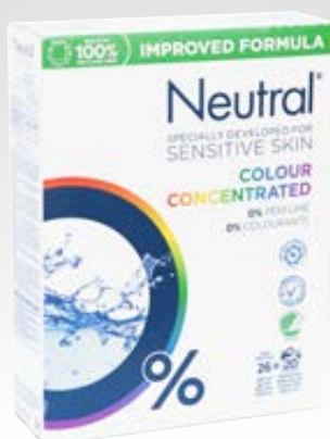
Neutral Colour Concentrated