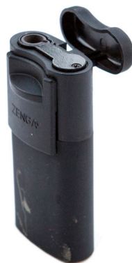
Slimmad stormtändare Teknikmagasinet