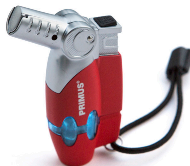
Primus Powerlighter Säljs hos flera handlare