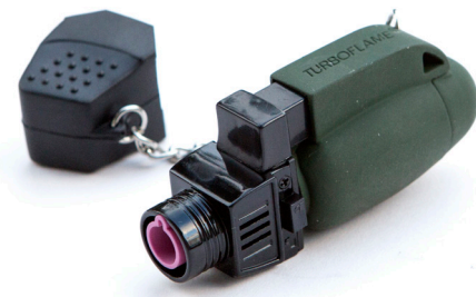
Turboflame Military Säljs av flera handlare