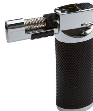
Kraftig stormtändare Kjell & Co