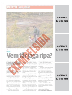
Exempel på annonsplacering.